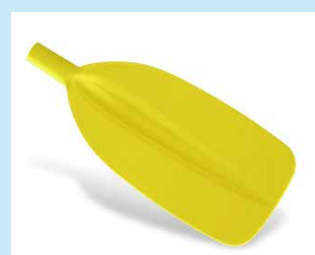
Lumi – rekreační kajakářské 720 Kč