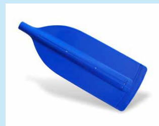
Slalom – robustní kanoistické 550 Kč