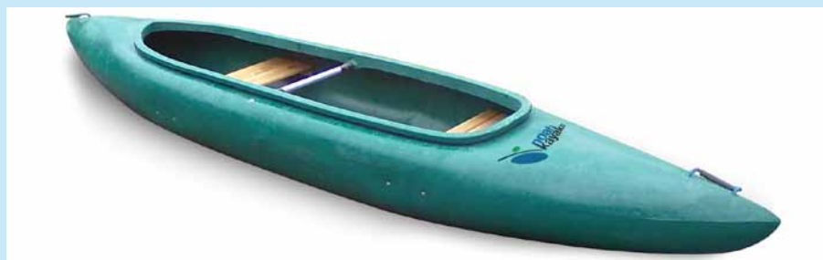
Canoah Turismo pro VS za 16 200 Kč nebo při více kusech za 15 120 Kč