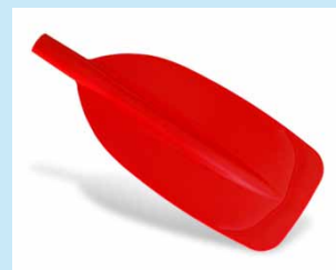
Joki – dětské kanoistické 520 Kč