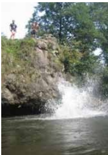
Vrbov – suchozemský oddiel

Prešov – suchozemský zbor s aktivitami na vode (10-15 miest vo vlastných lodiach). Majú zjazdený Dunajec, Torysu a Hornád.